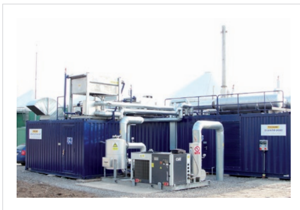
Биогазовая станция Хоньковце - GTS 800