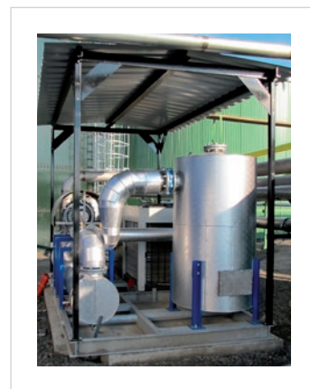
Биогазовая станция Пустеев - GTS 1200