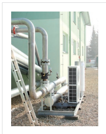
Биогазовая станция Высоке Мито - GTS 400